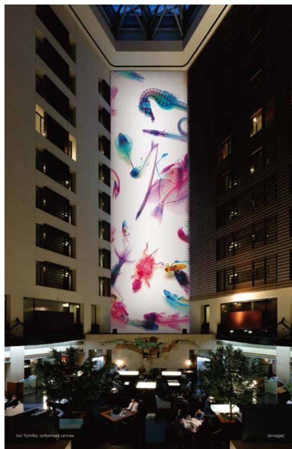
会場 / プロジェクション・マッピング (イメージ)